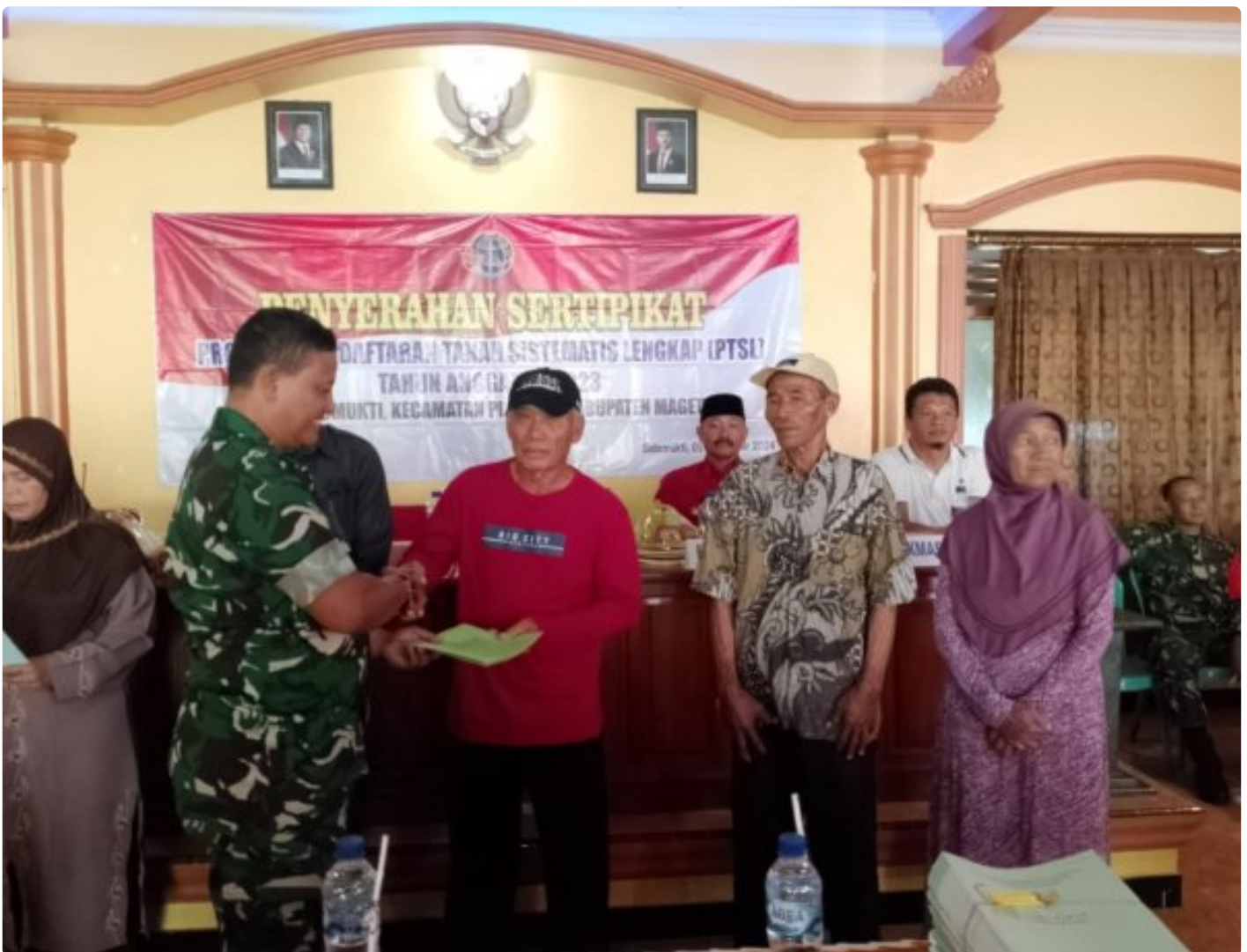
Danramil 0804/02 Plaosan Hadiri Penyerahan Sertifikat Program Pendaftaran Tanah Sistematis Lengkap (PTSL) Desa Sidomukti

PLAOSAN. - Desa Sidomukti melalui Badan Pertanahan Nasional (BPN)